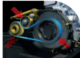
Κίνηση με ιμάντα