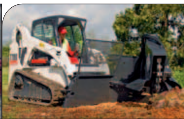
T190 / T190H