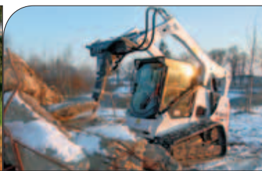
T650 / T650H