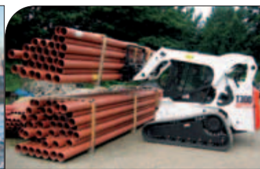
T300 / T300 H